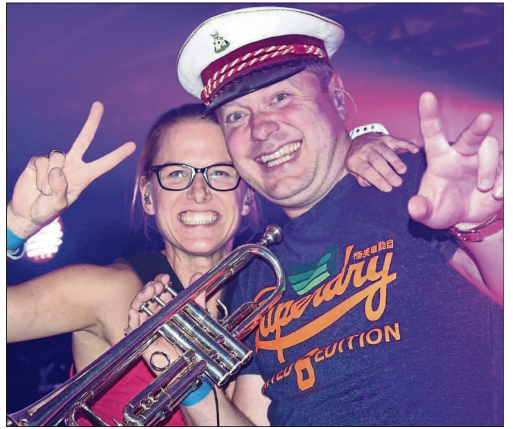
GuteLaune unterm Schützenhut: Bei der Jungschützenparty trifft jugendliche Feierlaune auf Tradition – und das passt sehr gut zusammen.