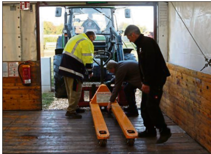
Wo die Muskelkraft versagt, muss der Trecker ran – und der fährt am frühen Sonntagmorgen fast bis ins Zelt.

Beim Umbau am Sonntag greift eine Hand in die andere