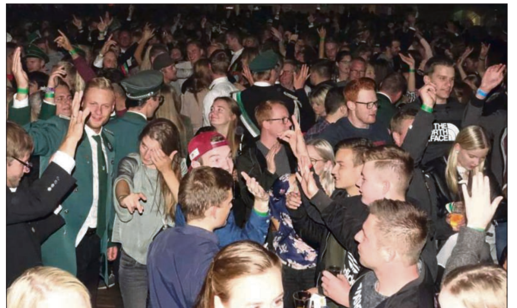
Die Arme hoch im vollen Zelt: Die Veranstalter hatten etwa 1500 Gäste angepeilt. Und nach ersten Schätzungen wurde diese Zahl auch tatsächlich erreicht.