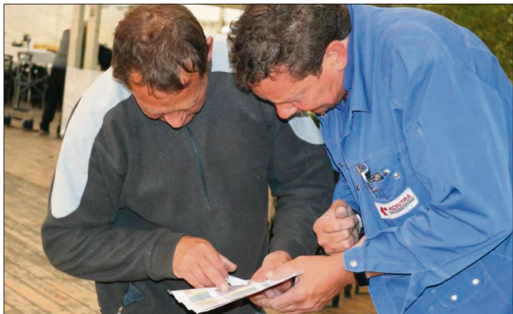
Lagebesprechung: Wo genau die Tische und Stühle hinkommen, ist kein Zufallsprodukt. Schließlich müssen die Helfer auch die Fluchtwege einhalten.

Kreisfest und Jungschützenparty – da trafen sich mit Tradition und junger Feierfreude scheinbare Gegensätze, die doch gut zusammenpassten. „Die Generationen zusammenbringen und Schützengeist weitergeben“, brachte es ein Bürgerschütze auf den Punkt. So gemischt feierten sie auch. Und wer die Uniform anhatte, kam umsonst rein. ■ arc