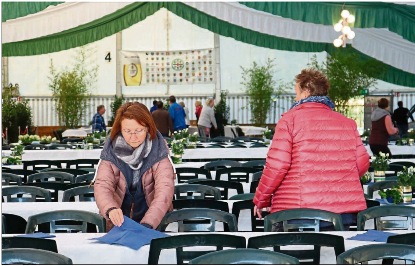
Auf die weiße Papiertischdecke kommen zwei blaue Servietten und darauf eine Blechdose mit Rosen, eine mit Efeu und ein niedlicher Esel. „Ich träume schon nachts von Deko“, erklärt eine der Helferinnen.